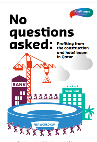
Figur 4 Laplane, J., E. Kaynar, J. Ramirez, M. Stravens, and J.W. van Gelder (2022) No questions asked: Profiting from the construction and hotel boom in Qatar

Alle investorene har svart på spørsmål om hvordan de sikrer at nordmenns penger ikke investeres i selskaper som kan knyttes til menneskerettighetsbrudd i Qatar. Men svarene er ikke betryggende. DNB har i etterkant av undersøkelsen valgt å selge seg ut av Accor, et av åtte profilerte hotellkjeder som rapporten har undersøkt. De opplyser til NRK at de selger seg ut da "selskapet har forhøyet risiko for å indirekte eller direkte bidra til brudd på menneskerettigheter og/eller arbeidertakerrettigheter". Les saken her , og rapporten her .